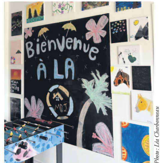
Dès qu'on entre dans la Maison des jeunes, nous sommes accueillis par le « mur des artistes »