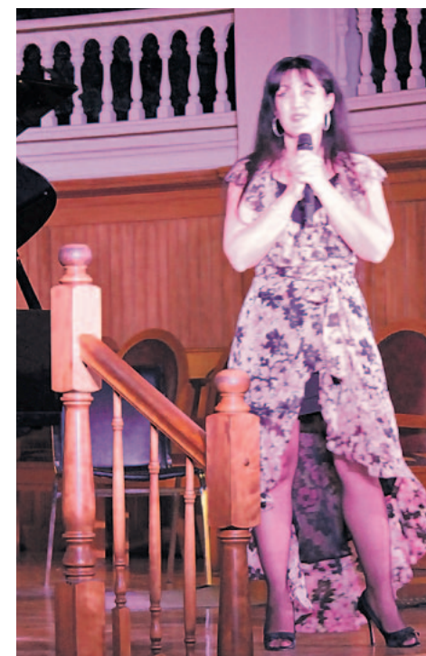
Une interprétation, à couper le souffle, d'Alleluia de Leonard Cohen par la cantatrice Giorgia Fumanti