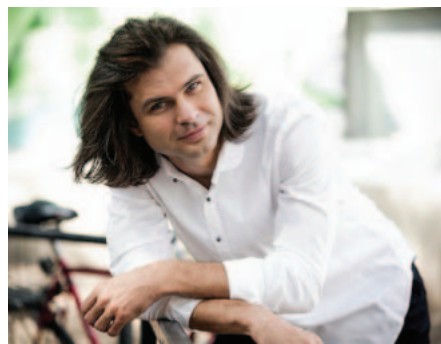
Le pianiste Serhiy Salov

Serhiy Salov est un pianiste d'exception reconnu pour son jeu à la fois énergique et empreint d'une grande musicalité. Il se distingue par sa technique remarquable, sa rigueur et sa virtuosité, des qualités qu'il met au service de la poésie musicale. L'enthousiasme du public et l'éloge de la critique confirment la place importante qu'il occupe sur la scène musicale internationale tant comme soliste que chambriste. En outre, Serhiy Salov s'illustre par ses transcriptions pour piano d'œuvres sym-