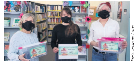
Dans le cadre du projet, Biblio Accès, des bénévoles iront porter une boîte de livres préalablement choisis par les aînés.