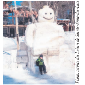
Le bonhomme de neige « Monsieur Ouimet » a vu le jour grâce à la famille Desmarais qui ont tous mis la main à la pâte... ou plutôt à la neige. – Gabriel Tournilhac a intitulé sa sculpture de bonhomme de neige « Tombé sur la tête ». Ce ne fut pas son cas. – « Pas de pantalon ». Eh oui, semble dire ce chien. C'est le nom de ce bonhomme. De toute façon, il ne semble pas avoir froid. – Le « Bonhomme Légo Maître castor » est impressionnant de par sa taille. Cette fillette ne le craint nullement. Malheureusement, elle ne pourra pas l'ajouter à sa collection de légos.

quatre gagnants choisis par la population.