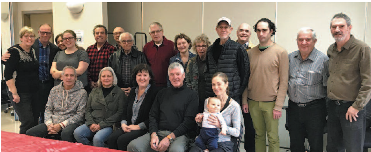
Déjeuner causerie regroupant les chefs de lac et les amis d'ABVLACS

L'ABVLACS, organisme communautaire unique en son genre, est actif tout au cours de l'année. Vous pourrez connaître en détail le bilan des activités de l'année 2018 et les nouveaux projets pour l'année 2019 lors de l'AGA qui aura lieu le 1 er juin prochain