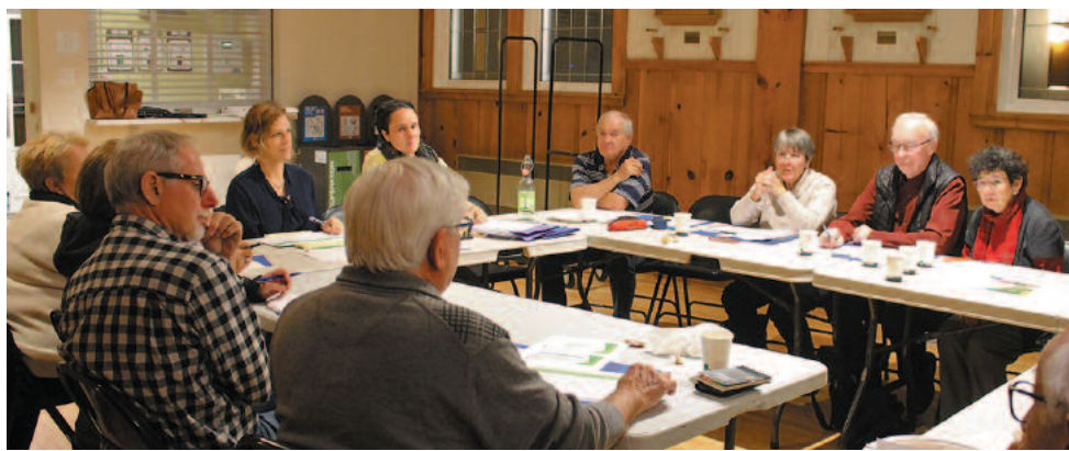
C'est au centre communautaire que le groupe de citoyens se sont réunis afin de discuter de la Politique familiale-aînés

En conclusion, la chargée de projet précisa qu'il fallait, avant tout, travailler localement pour arriver à harmoniser les plans d'action de tout un chacun dans le but de générer une seule et unique Politique globale de la MRC.