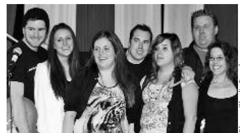
La formation Dream On' a été créée pour l'événement au profit de la fondation Rêves d'enfants. Chansons rock, punk, alternatif, etc. ont été interprétées avec brio pour émouvoir le public présent.

L'idée d'organiser un événement pour son projet personnel lui est venue l'an passé lorsqu'elle avait organisé une pièce de théâtre avec des amis. «J'avais eu un avant-goût de l'expérience l'an passé et j'ai eu envie de recommencer, mais cette fois, par moi-même. C'était quelque chose qui m'intéressait vraiment et je savais que ça allait m'apporter assez de motivation pour le faire jusqu'au bout sans me tanner», a