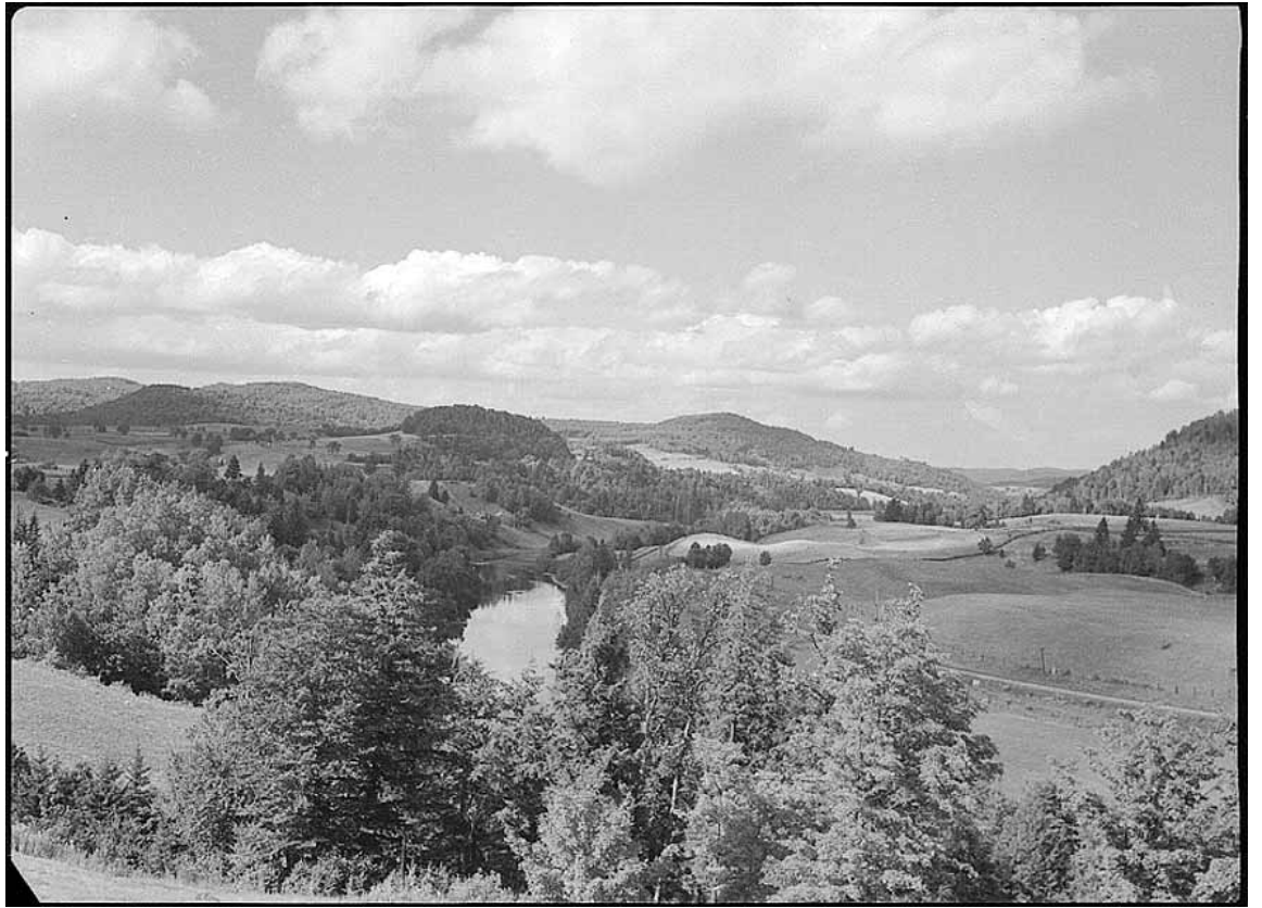
BENOIT GUÉRIN – La Rivière du Nord à Piedmont en 1946