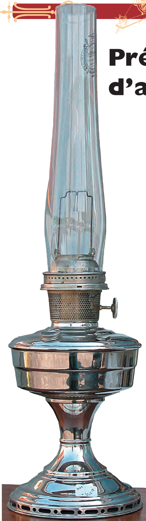
Lampe à manchon «Aladdin»

Il faut également mentionner que pour ces Antiquaires, leur commerce est souvent issu d'une grande passion et c'est de cette façon qu'ils peuvent aussi facilement et entièrement parler de leurs articles.