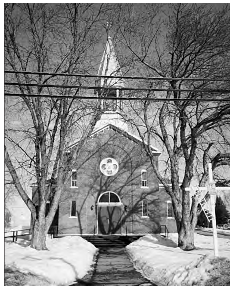
L'Église Saint-François-Xavier aujourd'hui.