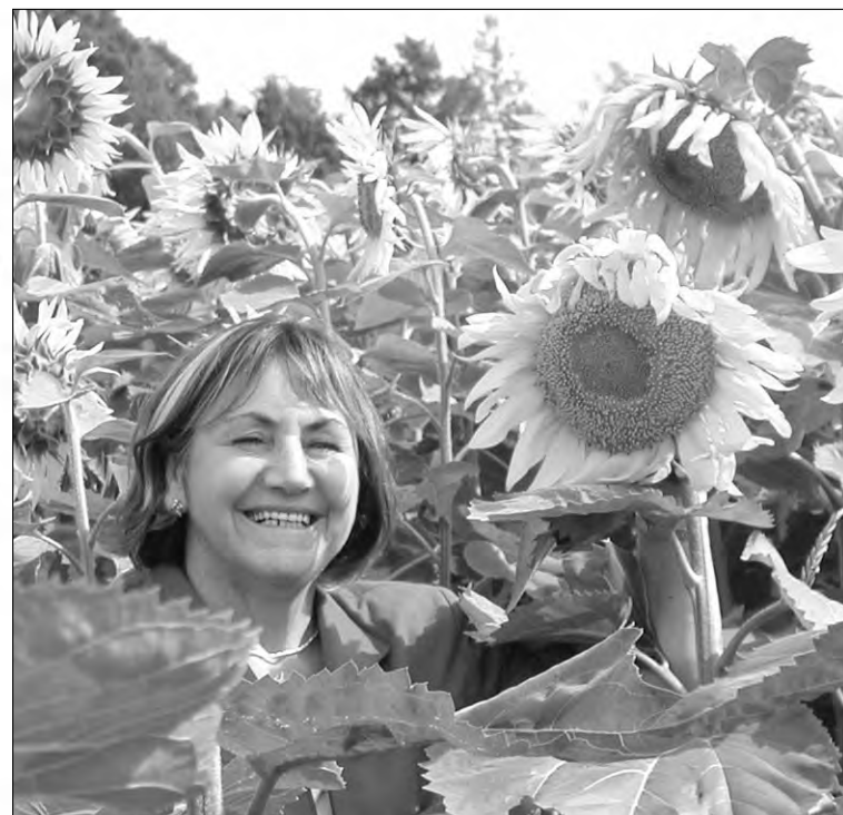
Avec le mois d'octobre à nos portes se termine notre saison Tours et Détours 2002. À l'été prochain pour d'autres méchants détours.

Pour les derniers week-end, le Parc Safari offre un ensemble cadeau à tous les automobilistes qui effectuent une visite chez eux. Le cadeau consiste en une bouteille de Crémant de Pomme «du Minot», une bouteille de vin québécois «Vignoble du marathonnier» et 5 kg de pommes McIntosh du vergers Petch. Par ce cadeau, le Parc Safari s'associe à la promotion des vergers dans sa région.