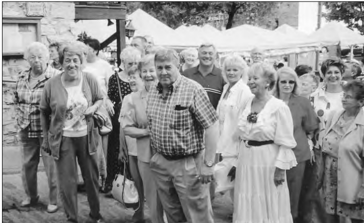
Les prévostois au petit Champlain.

Comme les saisons passent vite! L'été est presque terminé. Après trois mardis consécutifs sous la pluie (en juin), la pétanque a quand même débuté dans la joie. Les joueurs et les capitaines se présentaient tôt et tous se sont amusés fermement.