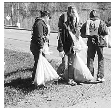
Scout à leurs locaux ou en appelant au numéro 450-432-5456.

Afin d'agrémenter cette journée, les commerçants qui voulaient participer financièrement ou en offrant de la nourriture (ou des boissons) à nos scouts pouvaient le faire lors du passage de nos membres du 41 e Groupe