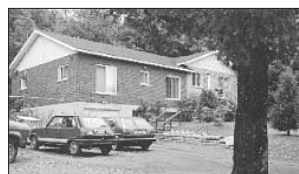
PRÉVOST - 1569, rue David. Prix 99 900$