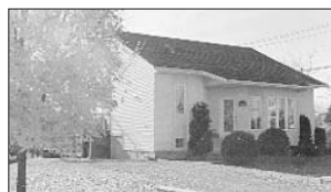
PRÉVOST - 1339, rue des Chênes. Prix 118 500$