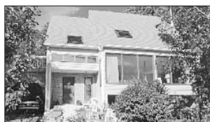
PRÉVOST - 1430 rue des Mésanges. Prix 164 900$