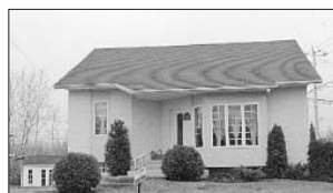
PRÉVOST - 1339, rue des Chênes. Prix 118 500$