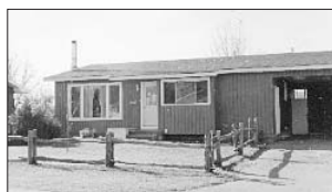
PRÉVOST - 237, rue des Pins. Prix 84 900$