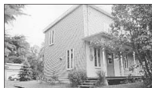
PRÉVOST - 830, rue Morin. Prix: 79 900$