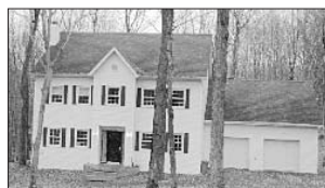
PRÉVOST - Domaine des Patriarches Prix 225 000$