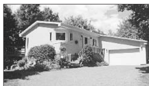
PRÉVOST - 1011, rue Monette. Prix 164 900$