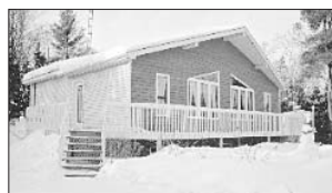
PRÉVOST - 200, rue de la Station E. Prix: 99 900$