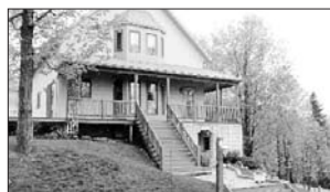
PRÉVOST - Domaine des Patriarches Prix 169 900$