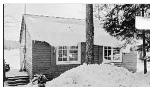
PRÉVOST - 1466, ch. Lac Renaud. Prix 99 900$