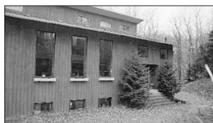
PRÉVOST - 945, rue Brosseau. Prix 195 000$