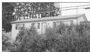
PRÉVOST - 1594, ch. du Lac Écho. Prix 65 000$