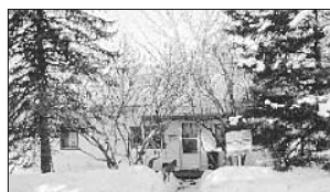
PRÉVOST - 1011, rue Leduc. Prix 72 500$