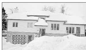
PRÉVOST - 1319, rue des Chênes. Prix 129 900$