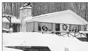
PRÉVOST - 1644, ch. du Lac René. Prix 99 900$