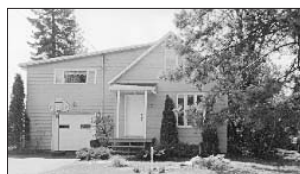
PRÉVOST - 883, rue Hotte. Prix 84 900$