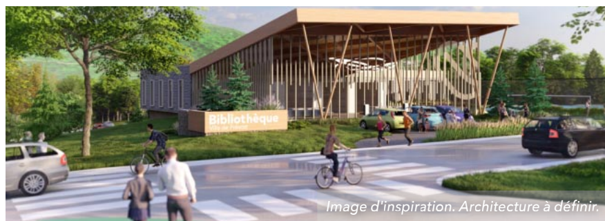
Image d'inspiration. Architecture à définir.

En ce qui a trait à la construction de la bibliothèque, pour laquelle Québec et Ottawa ont octroyé une subvention de 2,5 M$ en mai 2022, un appel d'offres sera publié au printemps 2025 en vue d'une inauguration à l'été 2027. D'une superficie cinq fois supérieure à l'actuelle bibliothèque, le nouvel édifice qui sera érigé à l'angle de la rue Principale et du chemin du Plein-Air (près des courts de tennis) offrira un lieu de rencontres culturelles en pleine nature. Une salle communautaire y sera greffée, remplaçant ainsi le Centre culturel et communautaire situé au 794, rue Maple qui a dû être fermé de façon définitive au mois d'août 2023 en raison de problèmes de moisissure et de contamination. L'actuelle bibliothèque satisfait à seulement 22 % des normes québécoises en matière de superficie.