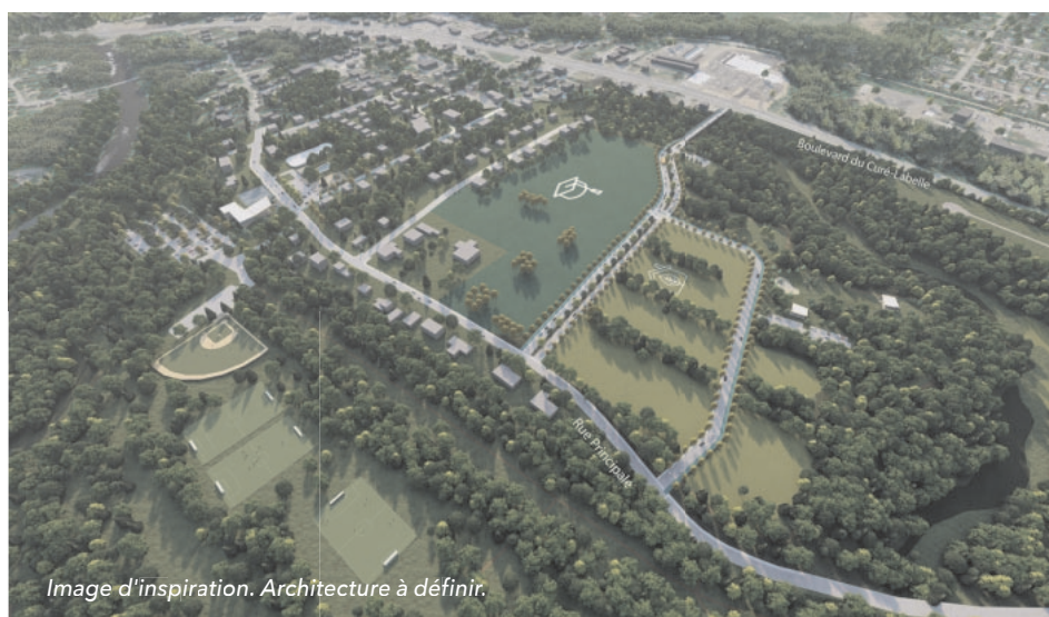
Image d'inspiration. Architecture à définir.

Après plus de six ans de concertation autour des projets d'école secondaire, de bibliothèque, et de salle communautaire, lesquels impliquent différents ministères et paliers de gouvernement, le Cœur des courants se veut un plan global de développement. Aussi, plus de 50 ans après la fusion de Shawbridge, de Lesage et de Prévost, il propose de donner à notre milieu un nouvel élan à partir d'un noyau attractif aménagé selon nos valeurs.