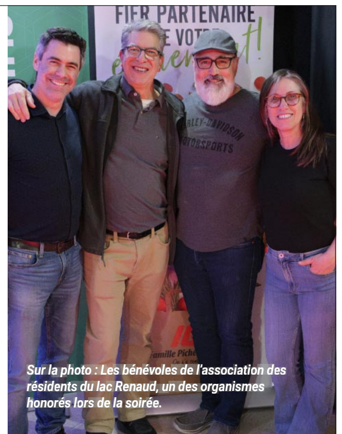
Sur la photo : Les bénévoles de l'association des résidents du lac Renaud, un des organismes honorés lors de la soirée.

Retrouvez toutes les photos de la soirée à : ville.prevost.qc.ca/hommage